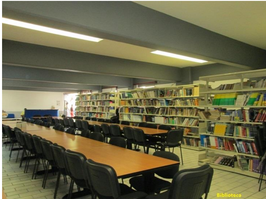
Figura 1. Biblioteca de la Facultad de Ingeniería de la UAGro

La Facultad de Ingeniería, que cobija a la Maestría en Ciencias en Tecnologías de la Computación, cuenta con una biblioteca en la que los estudiantes del programa podrán tener acceso a una pluralidad de libros, tesis y revistas especializadas, en físico, como también en forma digital.