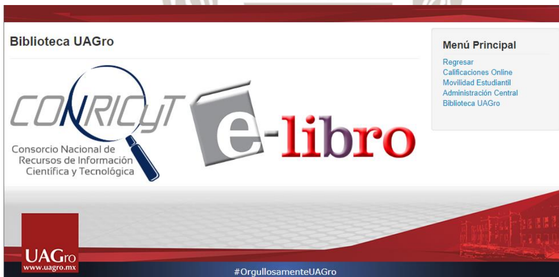
Figura 3. Acceso a la biblioteca Virtual y a CONRICyT de la Universidad Autónoma de Guerrero

El Consorcio Nacional de Recursos de Información Científica y Tecnológica (CONRICyT) está suscrita por esta Institución con los siguientes recursos de información científica y tecnológica: